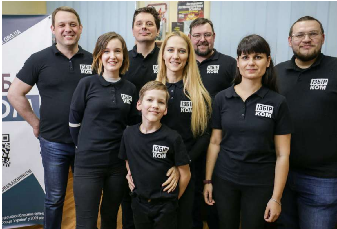
Вдячна вам команда видання ІзбірКом

Ми створили унікальну добірку відео з кнопкодавством місцевих депутатів.