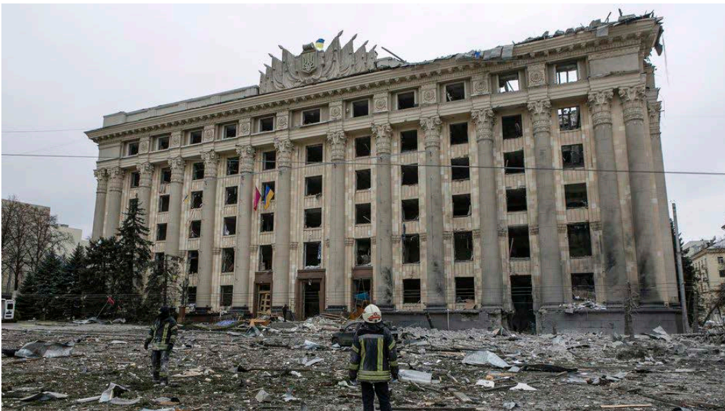
Харків, 1 березня 2022.