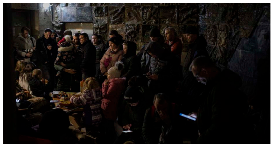
Львів, 19 березня 2022.