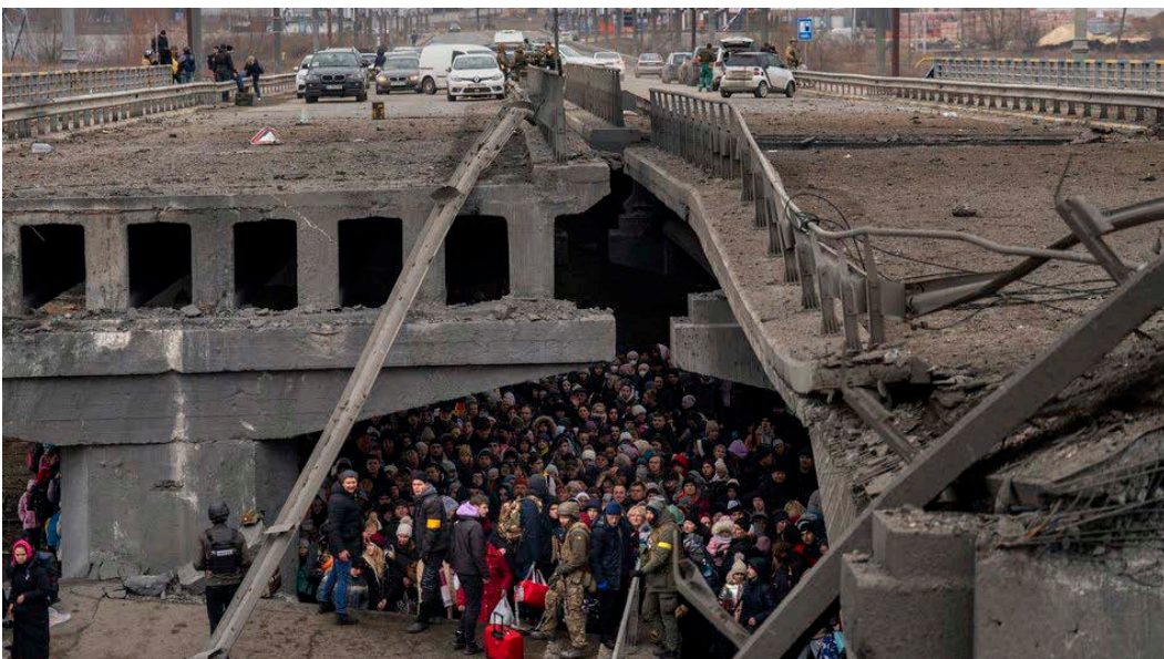
Ірпін, 5 березня 2022.