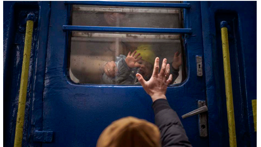
Київ, 3 березня 2022.