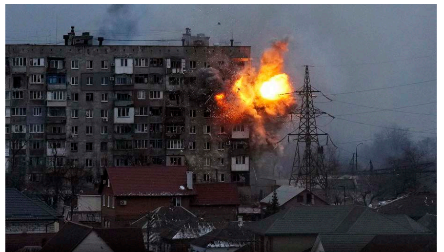
Маріуполь, 11 березня 2022.