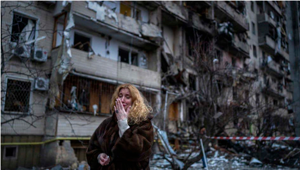
Київ, 25 лютого 2022.