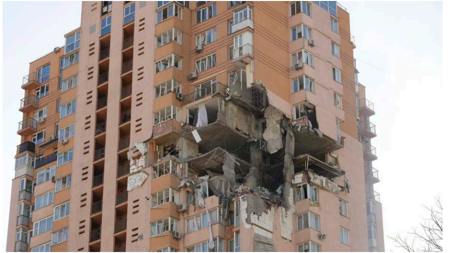
Київ, 26 лютого 2022.